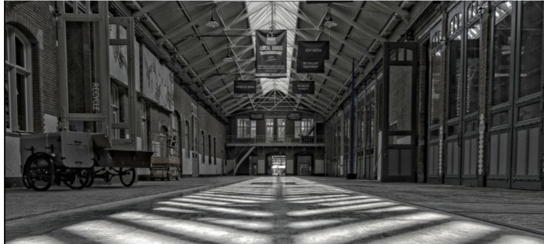
Food- en Filmhallen

De woningen liggen in een mooi stukje Amsterdam, met om de hoek de Food- en Filmhallen en het gezellige Bellamyplein. De Kinkerbuurt met een groot aanbod van leuke winkels en horecagelegenheden op steenworp afstand! Binnen enkele minuten fietsen ben je in het hart van Amsterdam.